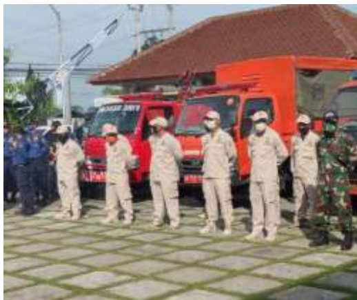
Persiapan, Partisipasi BPBD dalam penyemprotan disinfektan di Polres Purworejo