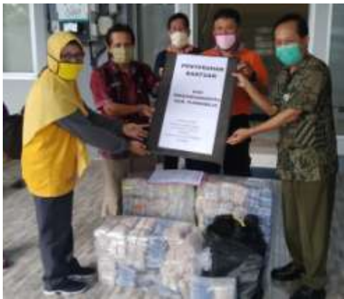
Penerimaan bantuan 10.000 masker dari Dinsosduk KBPPPA