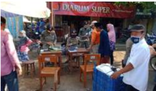
Operasi penindakan bagi pengunjung di pasar kemiri yang tidak menggunakan masker