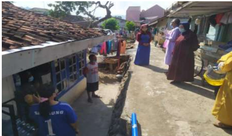
Kunjungan pendampingan di salah satu warga terdampak Covid-19