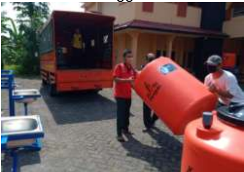
Penerimaan sekaligus pendistribusian wastafel portable dari UPT BLK Dinperinaker