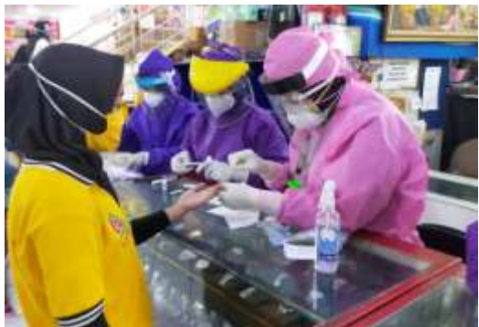
Test rapid di pusat perbelanjaan