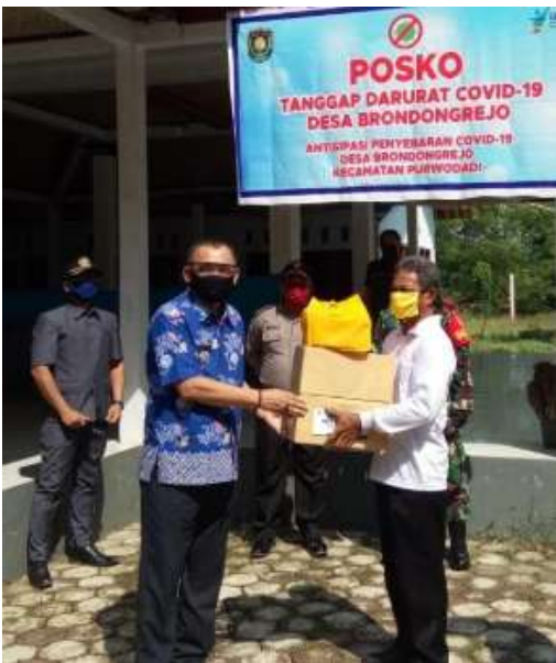
Penyerahan Jaring Pengamanan Sosial