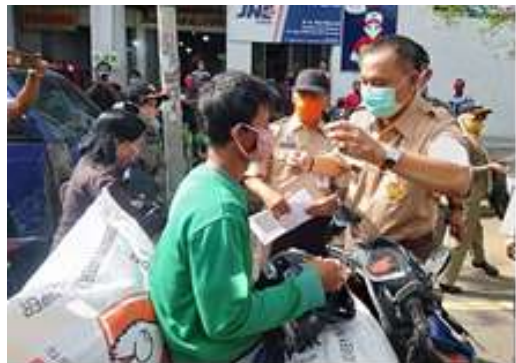
Bupati Purworejo membagikan masker pd saat sosialisasi Covid-19