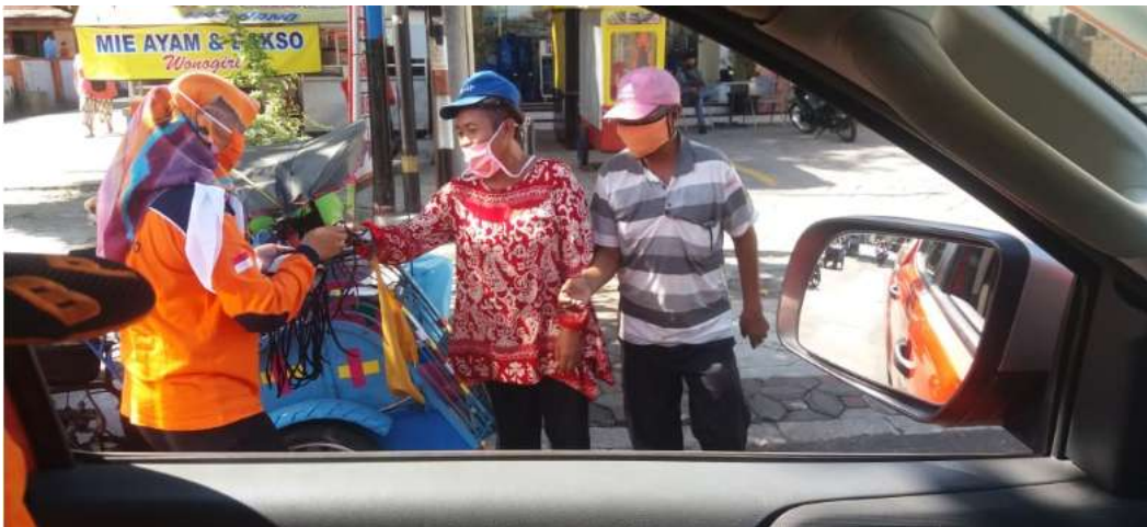
Kampanye melalui mobil keliling disertai pembagian masker kepada warga yg ditemui tidak memakai masker