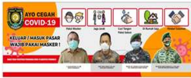
Salah satu banner kampanye Covid-19