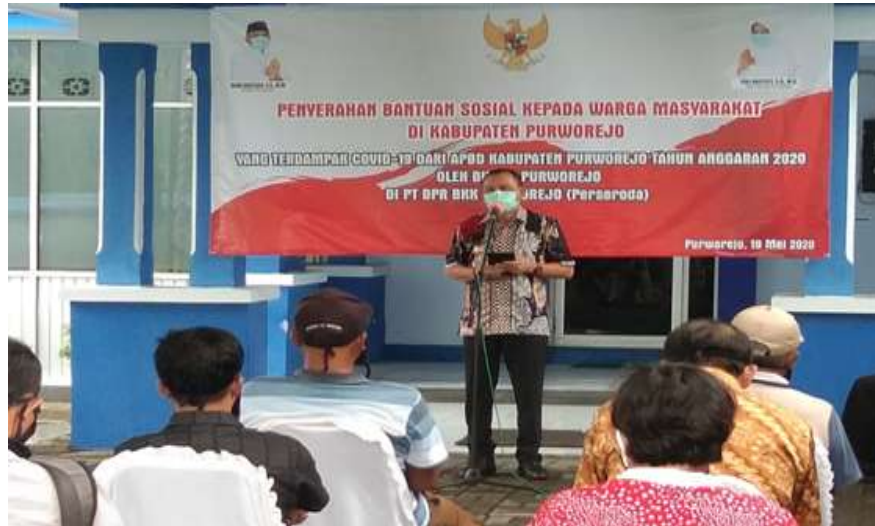
Bupati Purworejo saat memberi pengarahan kepada warga