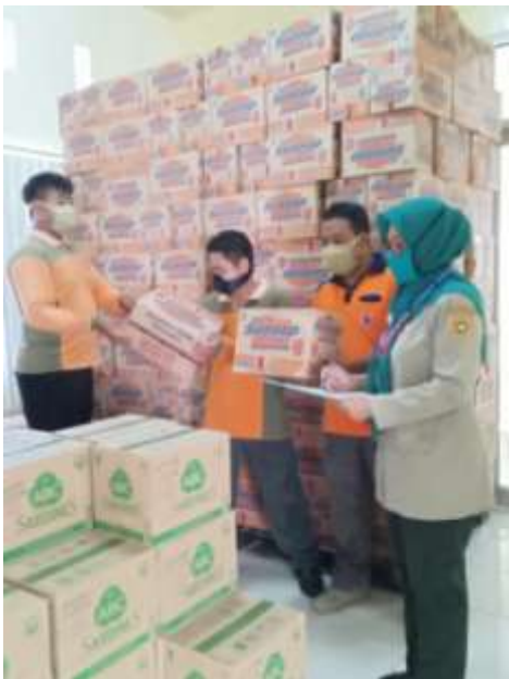
Stock opname gudang logistik Covid-19