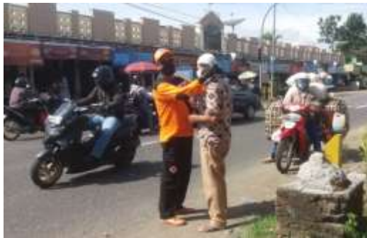
Sosialisasi penggunaan masker setiap pagi dan sore dilakukan oleh BPBD