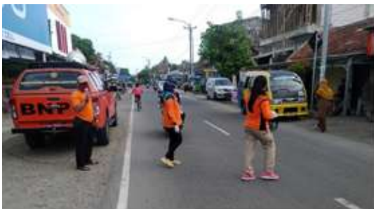
Kampanye Covid-19 dan pembagian masker