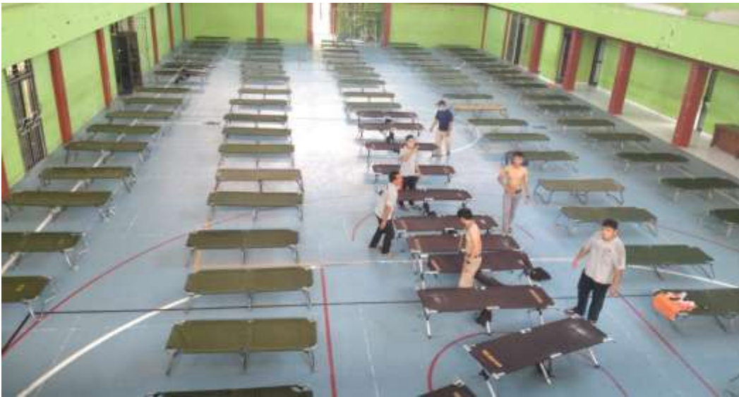
Penyuapan tempat transit bagi pemudik yang ditolak warga