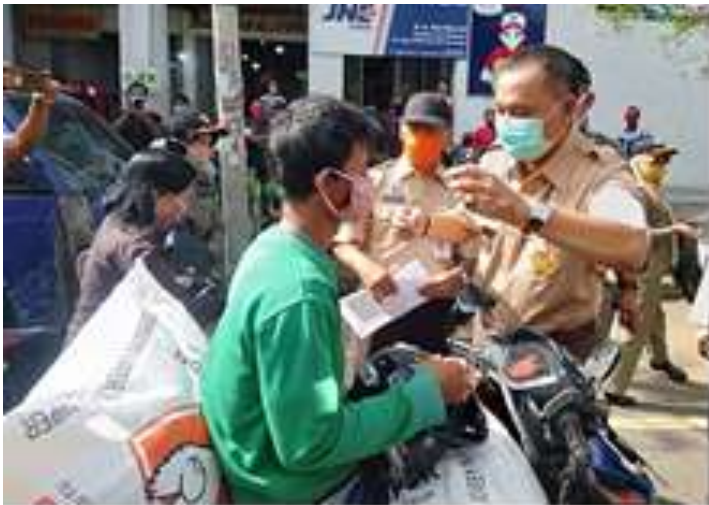
Kampanye masker oleh Bupati Purworejo di Pasar Baledono

dibagikan juga masker secara gratis disertai edukasi dan pembinaan kepada masyarakat yang belum sadar memakai masker.