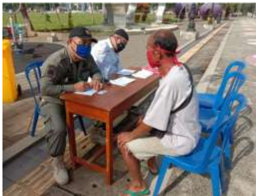
Operasi Penegakkan Perbup 29/2020