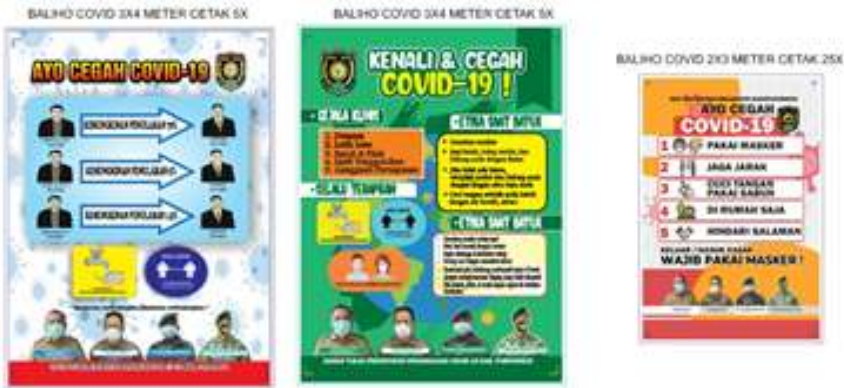
Ukuran 2 x 4