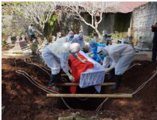
Pemakanman Pasien Dalam Pemantauan