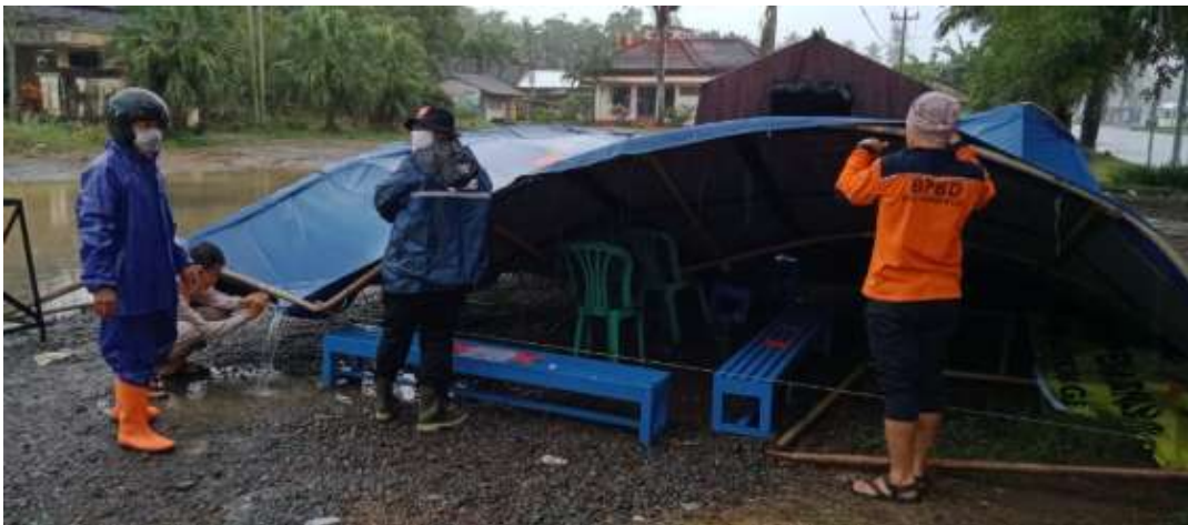
Evakuasi Tenda BPBD di Posko Pemantauan pemudik di Dadirejo bagelen yang roboh angin dan hujan