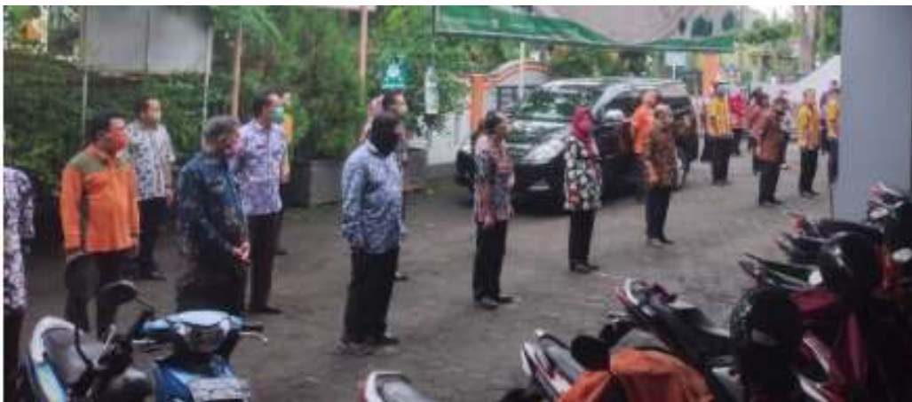
Apel pagi Pegawai BPBD yang tidak mengenal libur selama pandemi Covid-19