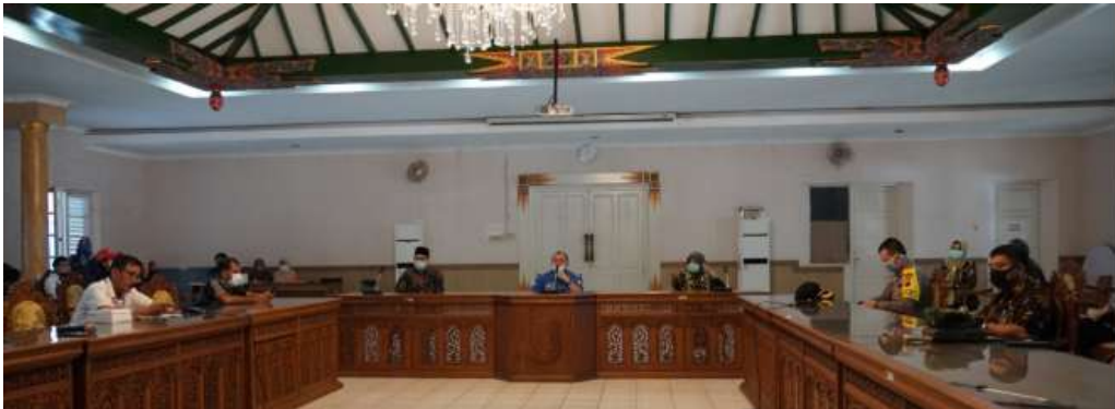
Konferensi pers ttg Penetapan Perpanjangan Status Tanggap Darurat Bencana Non Alam Pandemi Covid-19