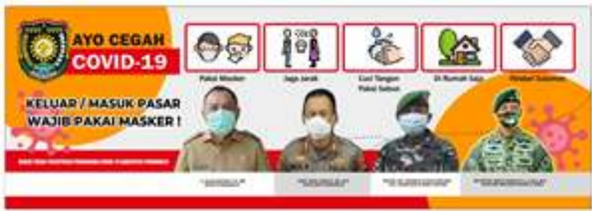
Ukuran 7,2 x 2,5 m

Disain Baliho, Spanduk Banner Koampanye Covid-19