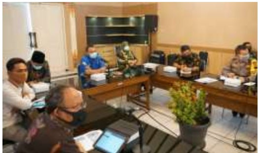
Rakor Penetapan Perpanjangan Status Tanggap Darurat Covid-19