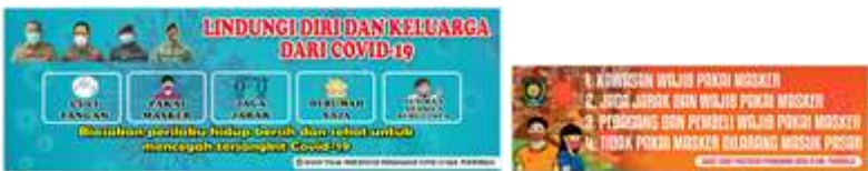
Ukuran 3 x 1